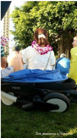
Une passionnée à l'échelle