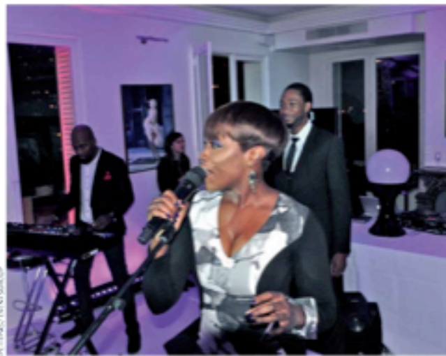
La chanteuse Estelle a assuré un showcase exceptionnel dans le salon de l'ancien appartement d'Alain Delon pour la fête de lancement de la nouvelle PlayStation Move.

Mardi, Cathy Guetta lance sa ligne de chaussures André aux Galeries Lafayette dans une ambiance ultra girly. Bonbons et chaussures géantes amusent la belle galerie, où l'on note la présence d'Émilie Dequenne, de Delphine Chanéac ou encore de Marie-Amélie Seigner. ■